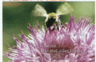
Smart Springt wie die Konkurrenz auf den aktuellen Trend Umweltschutz auf.

sion vor. Ab Montag läuft er u. a. in Deutschland, Frankreich und Großbritannien. Der Spot stammt nicht von der Lead-Agentur BBDO, sondern von der Agentur Neonred aus Hürth, die einen Projektetat ergattern konnte. the